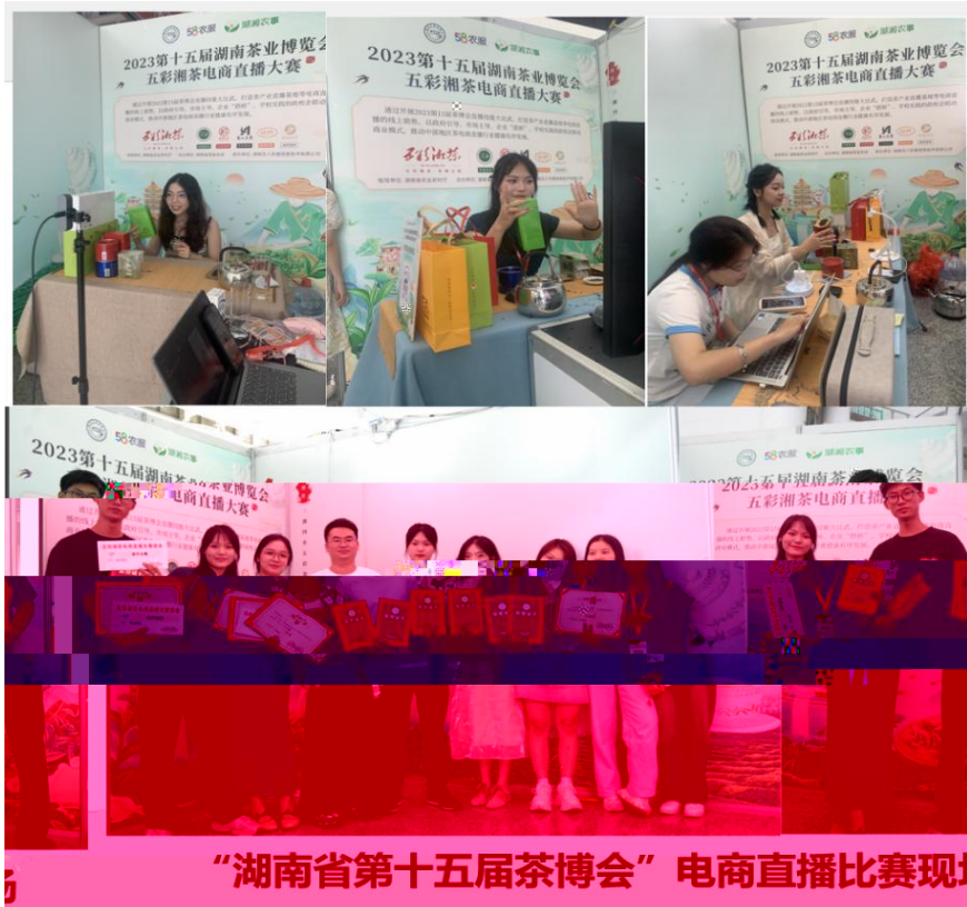
“湖南省第十五届茶博会” 电商直播比赛现场